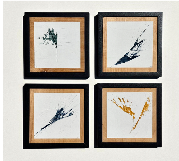
Gabriella Kirby , The Notes They Were Singing , 2021, mixed media on plaster framed with wood, 7x7 in (Framed) | 17.75 x 17.75 cm