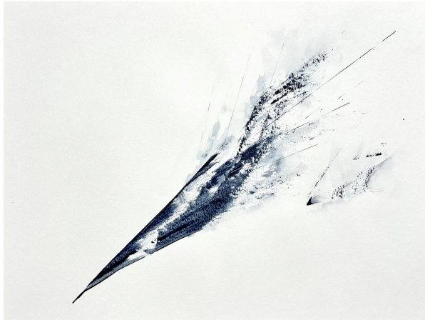
Gabriella Kirby , Singular Offset #1 , 2024 18 x 24 in | 45.75 x 60 cm

Contact: Jen Dragon 94 Highwoods Road · Saugerties, NY 12477 USA cell/text: +1 845-399-9751