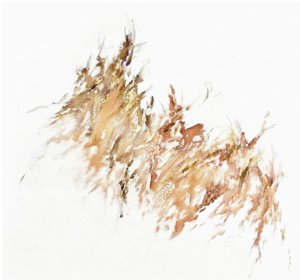
Gabriella Kirby , Untitled , pigment on canvas, 44 x 52 in | 111.75 x 132 cm

Beach, California; e Londra, Inghilterra. Tra i suoi progetti figurano un intervento di land art pubblica ad Ashland, OR e la partecipazione come artista a un'installazione presso il Museum of Craft and Design di Los Angeles, California. I suoi dipinti sono stati pubblicati su Vanity Fair di Londra (Regno Unito). Le sue opere fanno parte della collezione privata della School of the Museum of Fine Arts di Boston. Vive e lavora nello stato di New York.